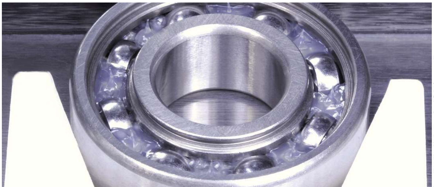
LFD-Produktion: Rillenkugellager mit Einstich am Innenring, fettgefüllt

In dieser Anwendung des klassischen Langsamläufers kommen LFD-Wälzlager mit besonders reinen Wälzlagerstählen zum Einsatz, gefüllt mit MoS 2 -additiven Schmierstoffen. So wird der hohen Kraftbelastung im Mischreibungsbereich optimal Rechnung getragen.